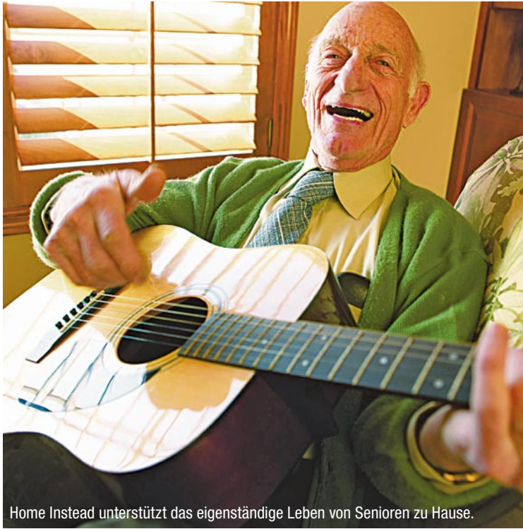
Home Instead unterstützt das eigenständige Leben von Senioren zu Hause.